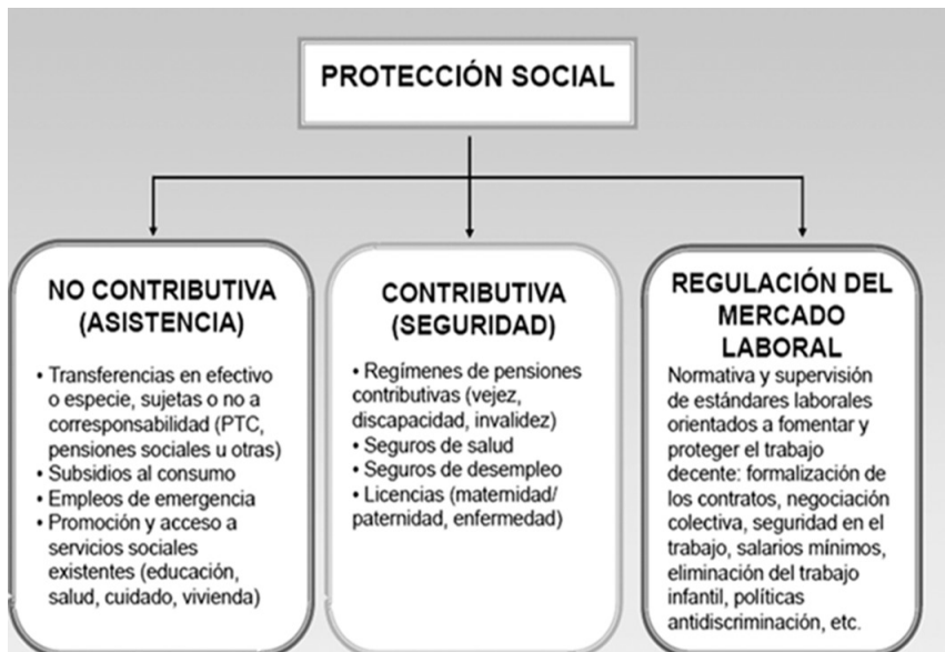
FIGURA 1: COMPONENTES SISTEMA PROTECCIÓN SOCIAL CHILENO

que el tercero, aún se encuentra en proceso de definición. La siguiente figura muestra los componentes esenciales del esquema de pilares: