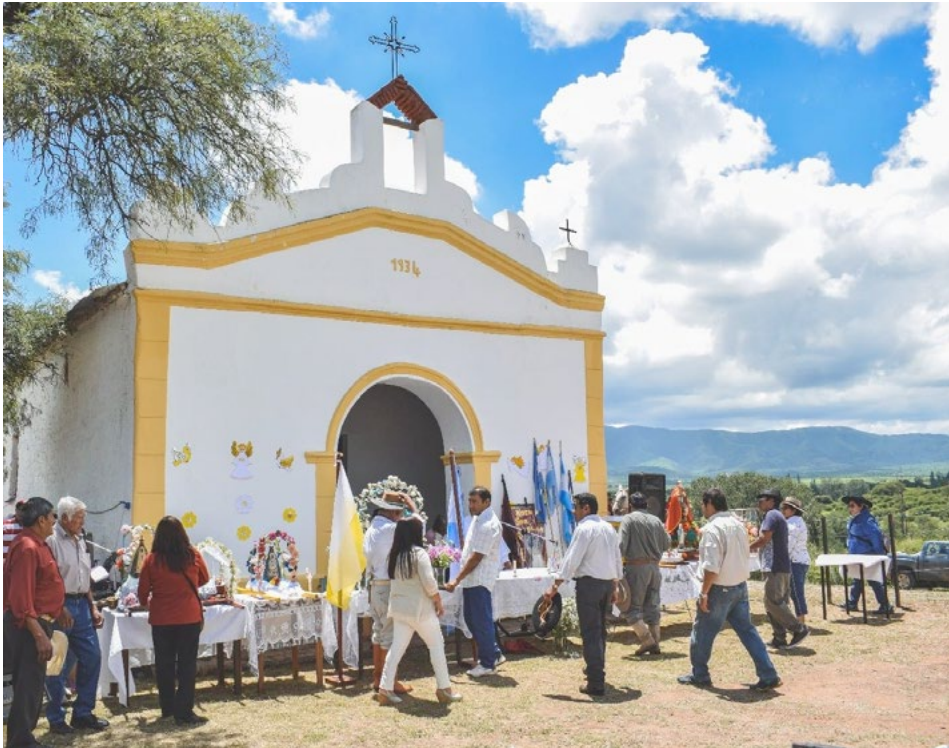
Figura 4. Participantes de la misa durante la Fiesta Patronal en su edición de 2018.

En su edición del año 2018, la ceremonia comenzó a las 11.00 hrs., luego de las confesiones y cuando el predio del altillo se encontraba colmado de gente, tanto dentro como fuera de la Iglesia. El predio se encontraba decorado para recibir a los peregrinos con flores y telas de colores en alusión a la bandera del Vaticano. Y como todos los años, la celebración inició con una procesión de entrada: los promesantes y peregrinos ingresan al predio de la iglesia junto a la Virgen, la cual es trasladada sobre el lomo de un caballo y acompañada por los gauchos de su fortín.