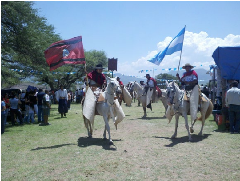
Figura 6 Gauchos portando las banderas de la República Argentina derecha) y de la Provincia de Salta (izquierda).

Hemos descrito las destrezas que realizan los mayores, sin embargo algunos de estos juegos son realizados por los niños, quienes también tienen su espacio para desplegar sus habilidades, y al igual que sus padres visten la indumentaria gaucha. Por ejemplo, una de estas destrezas es enlazar a un novillo pequeño, que es sujetado por una persona mayor mientras el relator cuenta cuál es su grupo de pertenencia y parentesco. Esto corresponde justamente a la importancia que se le da a la transmisión de la cultura-tradición a partir de un proceso de endoculturación que se realiza dentro del hogar cuando estos niños acompañan y ayudan a sus mayores, las destrezas gauchas son la exhibición de las actividades de campo, por tanto el puesto de ganador correspondería a ser el más hábil e idóneo en estas tareas.