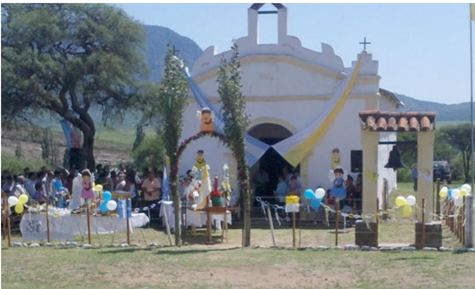
Figura 3 Fotografía del “altillo” adornado para la fiesta.

Los preparativos para la fiesta comienzan varios días antes, cuando peregrinos, pobladores, promesantes y visitantes se acercan al “altillo”, una vivienda que se ubica a metros de la Iglesia del poblado, donde se reúnen para limpiar el lugar (durante el resto del año no se encuentra habitado, sino que se reserva exclusivamente para esta ocasión), adornar la iglesia para la festividad con pancartas, telas, globos, entre otros, y elaborar grandes cantidades de alimento para agasajar a los invitados. Por ejemplo, en la edición del año 2018 fueron carneados cuatro animales vacunos, con los cuales se produjeron alrededor de 5 mil empanadas y 4 hornos repletos de guatia 15 ,