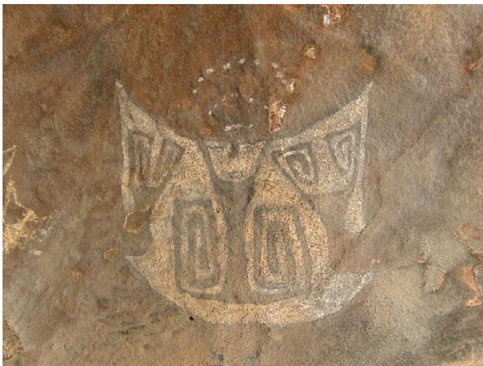
Figura 2 Fotografía de un hombre escudo en el alero norte de las Cuevas Pintadas de Guachipas.

En toda esta región las piezas arqueológicas son develadas tras las lluvias de verano, asimismo, los sitios con arcilla de origen arqueológico son conocidos por los lugareños. En este sentido, podemos afirmar que el Paraje de Las Juntas es el más favorecido, estando arqueológicamente asociado a los sitios con pinturas rupestres muy presentes en la zona. La mayor parte de esta iconografía se encuentra en lo que se conoce como Las Cuevas Pintadas, donde las figuras de los hombres-escudos , el zuri y las llamas son fácilmente reconocidas. Por su parte, hacia el sur se encuentra el paraje de Pampa Grande, donde se destacan las piezas de bronce que dan cuenta del desarrollo de avanzadas técnicas de metalurgia antes de la Conquista.